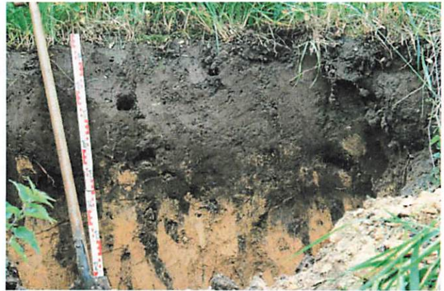
Abb. 1: Das Schwarzerde-Profil von Asel